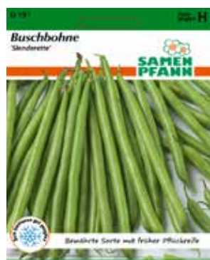
G131 Buschbohne Slenderette

Intensiv grüne Buschbohne, schlanke, fadenlose, dunkelgrüne Sorte mit sehr gutem Geschmack. Bildet zarte, runde, ca. 14cm lange Hülsen. Frühe Pflückreife, reichtragend. Für Frischverzehr und zum einfrieren geeignet.