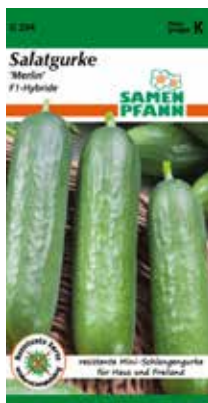
G294 Salatgurke Merlin

Rein weiblich blühende Mini-Schlangengurke - Neue Top Profisorte. Sehr Ertragreich. Für Anbau im Haus und im geschützten Freiland geeignet. Bildet eine große Zahl ca. 15-18 cm langer, saftiger, knackiger Früchte mit glatter Schale, in erstklassiger Qualität. Resistent gegen Echten Mehltau.