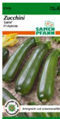
G516 Zucchini Laria

Rein weiblich blühende Mini-Schlangengurke - Neue Top Profisorte. Sehr Ertragreich. Für Anbau im Haus und im geschützten Freiland geeignet. Bildet eine große Zahl ca. 15-18 cm langer, saftiger, knackiger Früchte mit glatter Schale, in erstklassiger Qualität. Resistent gegen Echten Mehltau.