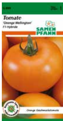
G899 Tomate Orange Wellington

Ertragreiche Pflanze mit kurzen Trieben und feiner Maserung. Dunkelgrüne, glänzende Früchte mit viel Geschmack. Resistent gegen Krankheiten.